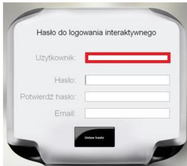
Rys. 5. Aktywacja konta internetowego

Po ustawieniu i zatwierdzeniu tych danych nastąpi zalogowanie do serwisu na kiosku BCW.