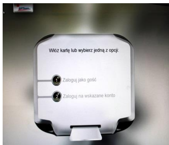
Rys. 1. Strona startowa kiosku BCW.

Po podejściu do kiosku BCW użytkownik napotka wygaszacz ekranu lub stronę startową – Rys. 1.