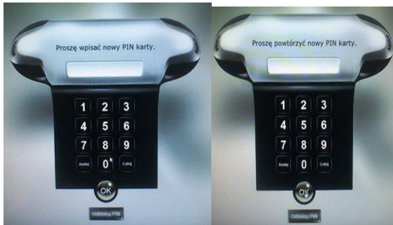
Rys. 4. Wprowadzenie i weryfikacja PIN-u

W następnej kolejności system sprawdzi czy konto internetowe zostało aktywowane.